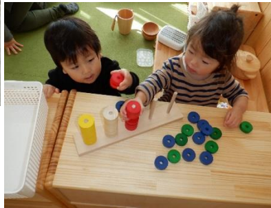
キアラ保育室の風景