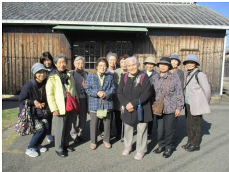
予防デイサービスのみなさんで、江井ヶ嶋酒造（明石市）に行ってきました