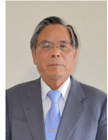
愛の園を支える会